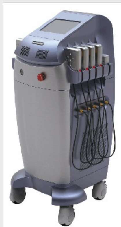
LipoLaser Body Slimming FG 660H-001

Die Lipo-Laser-Behandlung wird auch zur Behandlung von Cellulite eingesetzt. Ebenso soll ein hautstraffender Effekt entstehen..